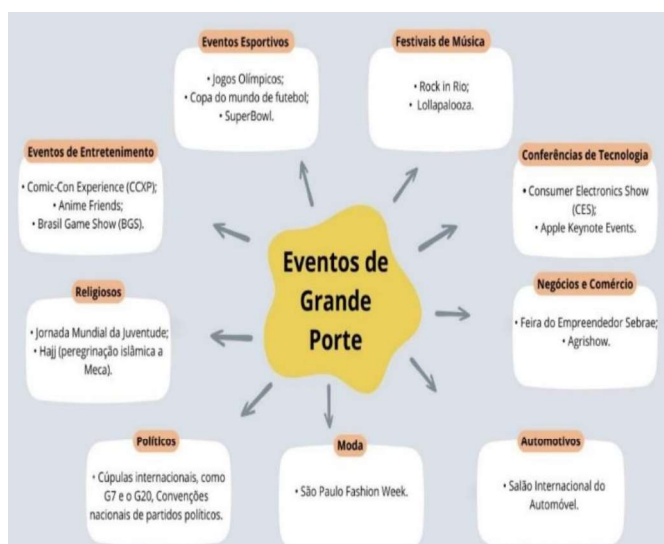
Figura 1 – Eventos de grande porte

Para Allen et al. (2008), eventos de grande porte são caracterizados por sua capacidade de atrair um grande número de pessoas e uma ampla cobertura da mídia, além de gerar impactos econômicos substanciais. A Figura 1 apresenta alguns exemplos dessa ampla variedade de eventos considerados de grande porte.